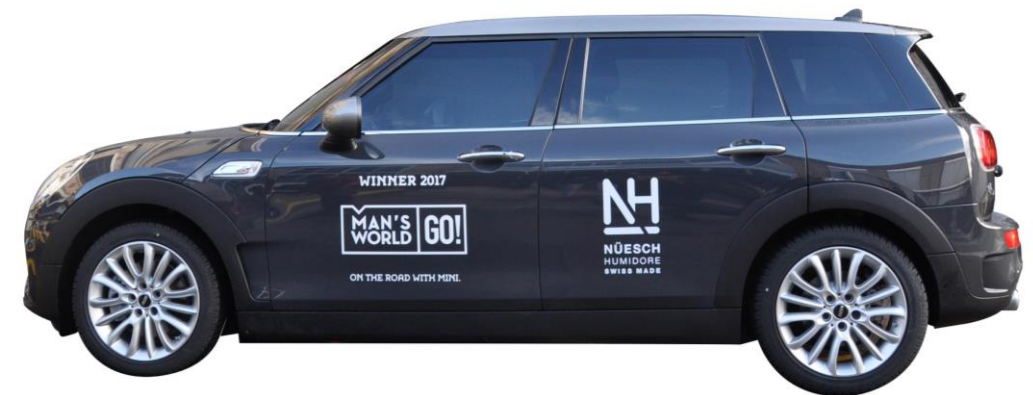
Man's World GO! Gewinner Fahrzeug 2017