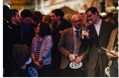
Besucher im Auktionsfieber

Event-Informationen zur Man's World vom 9.-11. März, sowie Vorverkaufs-Tickets für Event und Charity-Auktion: www.mansworld.com .